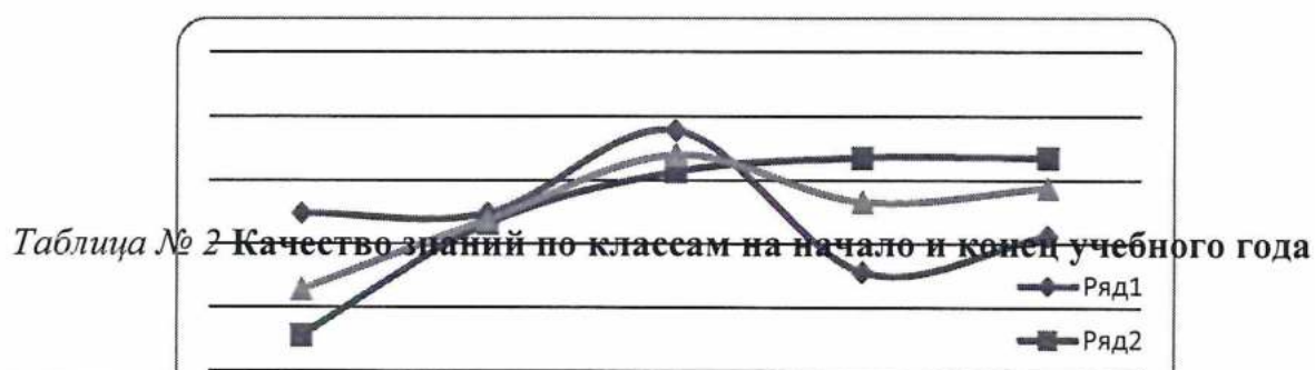
Таблица № 2 Качество знаний по классам на начало и конец учебного года